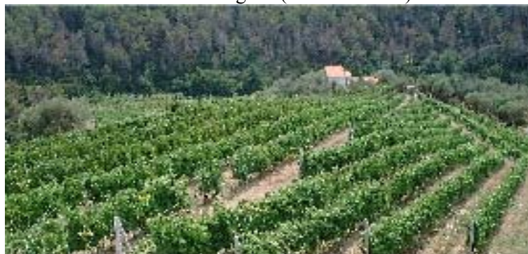
Tenuta di Trigoso (Sestri Levante)

E' un vino da meditazione o per accostamenti con pasticceria secca.