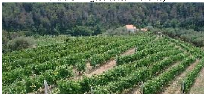
Tenuta di Trigoso (Sestri Levante)

ENOTECA BISSON di Lugano Pierluigi e C. sas C.so Gianelli, 28 - 16043 Chiavari (GE) Cod. Fisc. e P. IVA 01008600999